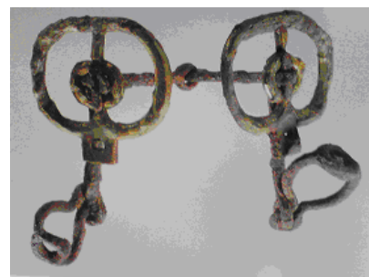
右写真=楕円形鏡板付 くつわ 轡

{ 5世紀前半 滋賀新開1号墳 福岡 日拜塚古墳 『日本馬具大鑑1 古代上』収録 }