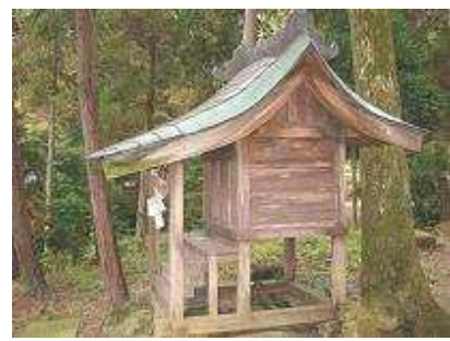
有木神社(本文は26ページ下段)