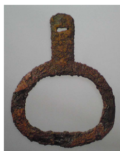
中写真=木心鉄板張輪 あぶみ 鐙